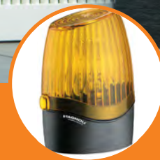
Lampeggiante a Led Pegasus.

Pair of Venus two-channel rolling code transmitter.