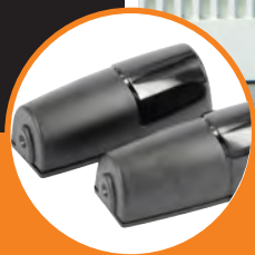
Coppia di fotocellule da parete Argo.