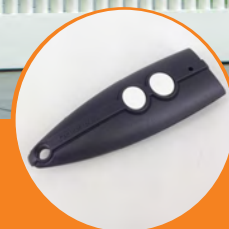
Coppia di Trasmettitori rolling-code bicanale Venus.

Pair of Venus two-channel rolling code transmitter.