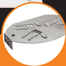
Completo di piastra di fondazione.