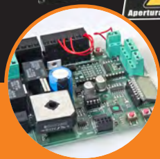
Centrale di comando con ricevitore.