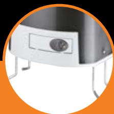
Fornito con piastra fondazione. Supplied with base plate.