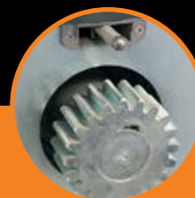
Ingranaggio M6. Gear M6.