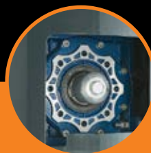
Sistema di sblocco. Unlock system.