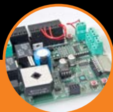
Centrale di comando con ricevitore. Control board with receiver.