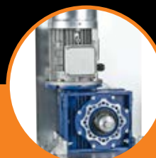
Fornito con piastra fondazione. Supplied with base plate.